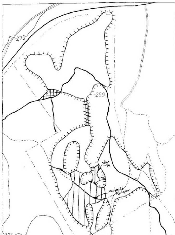
Fig4 Evaluering av skjøtsel 1997-2001 Slått høst 3. & r start 1997 <<< +00 start 1998 <<< +01 start 1999 |||